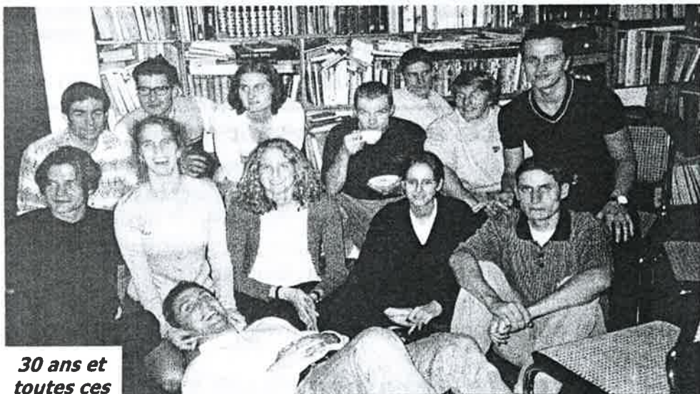
30 ans et toutes ces dents ?

🕒 Si les conditions le permettent, Pat & Stéf vous proposent des journées hivernales: snowboards, skis, randonnées à ski de fond, ... Si vous voulez savoir ce que le week-end à pour menu ou que vous vouliez proposer une activité, téléphonez au 691'77'85 le JEUDI SOIR avant le dit week-end!