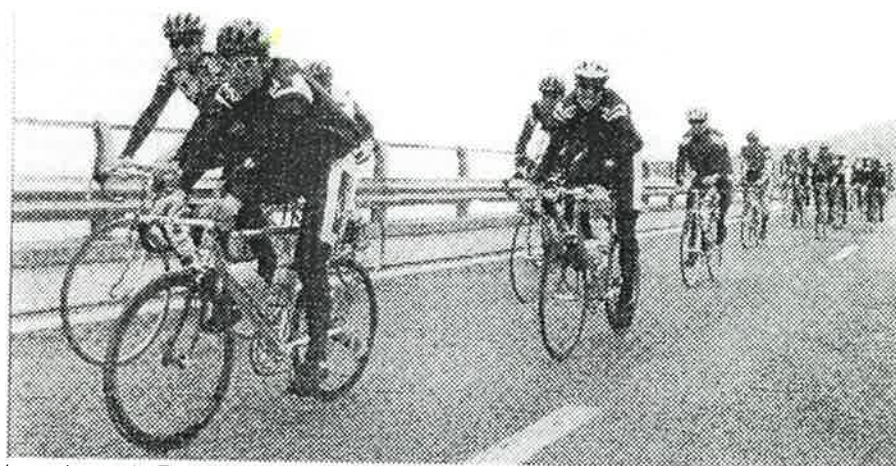
Le peloton du TDFO 97